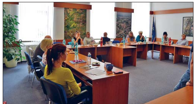
INTENZIVNÍ školení domovníků-preventistů proběhlo v druhém pololetí července v zasedací místnosti mariánskohorské radnice.