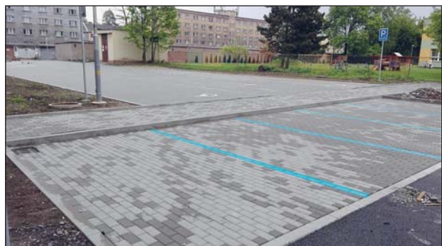
NOVĚ parkoviště u MŠ Zelená nabízí řidičům 34 nových parkovacích míst.