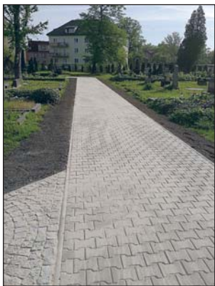
NOVĚ vybudovaný chodník na mariánskohorském hřbitově.

U Mateřské školy Zelená se v květnu dočkali obyvatelé hned 34 nových parkovacích stání. „Vytipovali jsme místa, která byla pro parkování v blízkosti školky nejvhodnější, abychom rodičům přivážení a odvoz dětí co nejvíce usnadnili. Kapacita parkování se tak v daném místě navýšila až sedminásobně a nová parkovací stání jsou k dispozici taky lidem bydlícím v blízkých bytových domech,“ nastínila starostka. Řidiči také jistě zaregistrovali, že na ulici Baarové byl na přelomu roku opraven zpomalovací práh prodloužením nájezdů. Zpomalo-