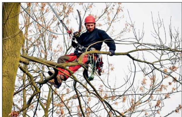
ARBORISTÉ na základě pokynu vedení mariánskohorské radnice zkontrolovali již většinu stromů v obvodu.