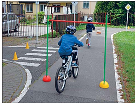
záběry z akcí pořádaných městskou policií.

Po dobu letních prázdnin je možné si vše bezplatně zapůjčit v době 10 do 19 hodin, s výjimkou doby od 13 do 14 hodin, kdy se koná provozní přestávka. Nad rámec běžné otevírací doby se na dopravním hřišti uskuteční také akce pro veřejnost, na kterých si děti mohou vyzkoušet testy