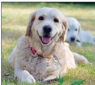
LOŇSKÁ vítězka, retrieverka Amy.

„Přihlášení je jednoduché. Pro soutěž jsme na adrese www.misspes.cz vytvořili nové webové stránky, prostřednictvím kterých stačí přes internet nahrát jednu až pět fotografií zvířátka a v jednoduchém formuláři připsat pár údajů o něm. Pokud by pro někoho bylo jednodušší poslat